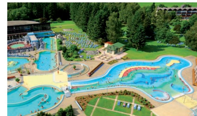
Erleben Sie das Johannesbad - Bad Füssings größte Therme mit 4.500 qm Wasserfläche, 13 Becken, 5 Saunen & Heilquelle